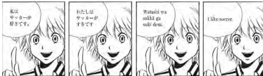
<図 3> マンガ

「基本スキット」では、スキットの内容がマンガでも描かれている。このマンガにおいても、セリフの表記を自由に選択できるようになっている (図 3)。またマンガのセリフの吹き出しをクリックすることによって、そのセリフを音声で聞くことができる。