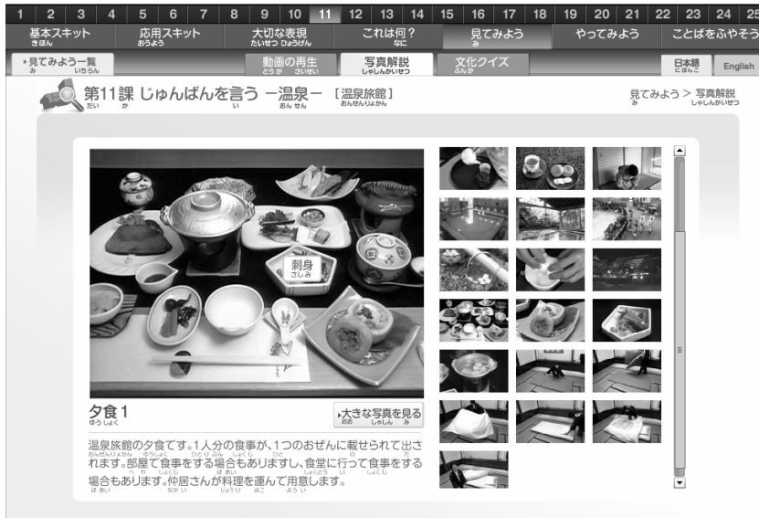
<図 6> 写真解説