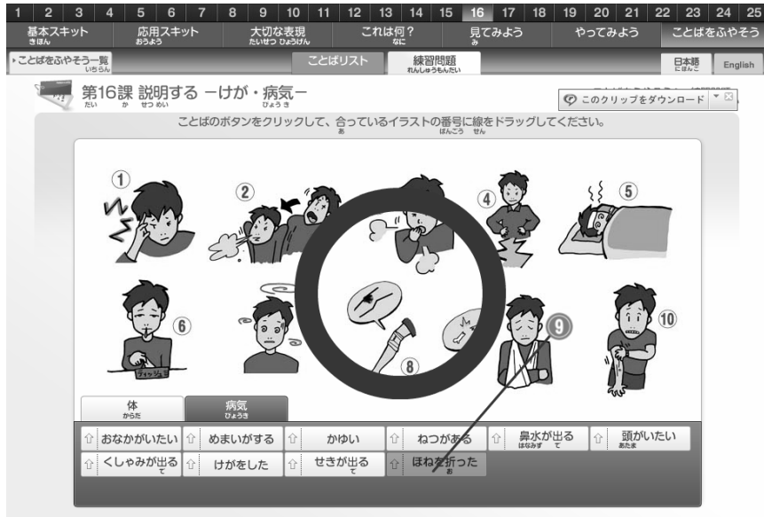
<図 5> ことばを ふやそう