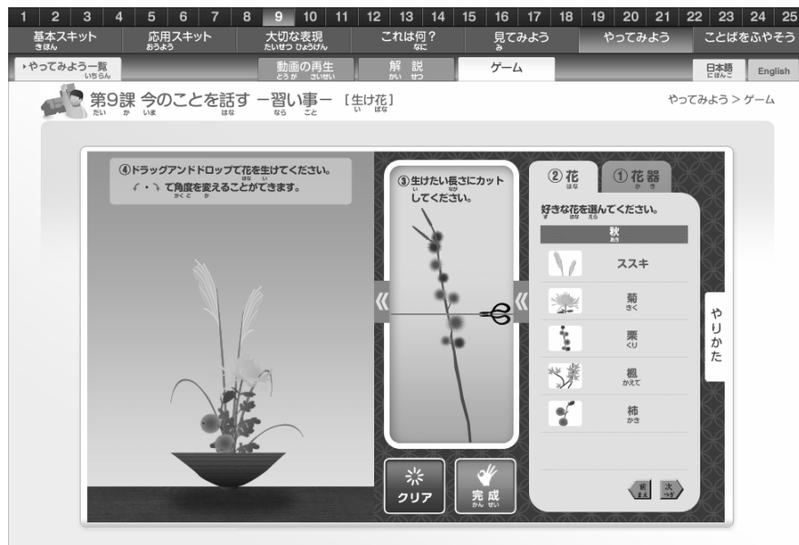
＜図 8＞ ゲーム