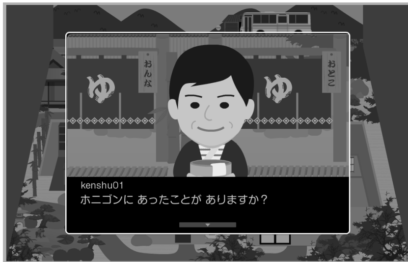
<図9> にほんご クエスト

「にほんごクエスト」では、自分が作成したアバターを使ってゲーム上のキャラクターと会話することができる。このとき選択できる会話は、最初は1種類しか選択できないが、課の学習を進めるにしたがって、その課のCan-doを使って話しかけることができるようになる。同じキャラクターでも違ったCan-doを利用して話しかければ、違った反応が得られるようになっており、その結果として、特別なイベントが発生したり、特別なアイテムが入手できたりする。全てのCan-doを達成し、キャラクターからもらった「秘密の呪文」をそろえれば、ゴールに行くことができるような仕組みになっている。