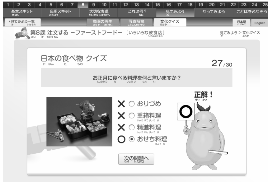
＜図 7＞ 日本文化 クイズ